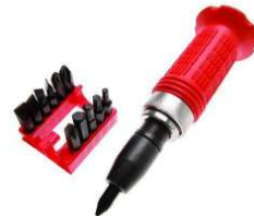
TOURNEVIS A FRAPPER