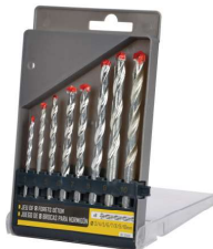
COFFRET DE FORET A BETON