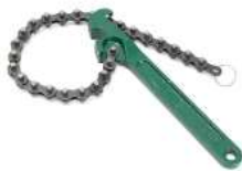
CLE A CHAINE POUR FILTRE