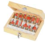
COFFRET FRAISE A DEFONCER