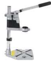
SUPPORT POUR PERCEUSE