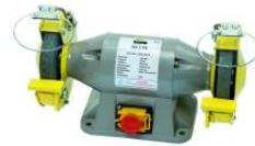
TOURET A MEULER