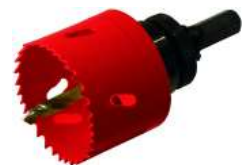
KIT SCIE TREPAU