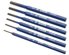
JEU DE CHASSE GOUPILLE