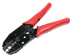
PINCE A SERTIR