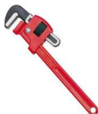
CLE A GRIFFE