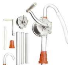
POMPE ROTATIVE GASOIL