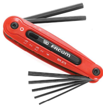
JEU DE CLE ALLEN