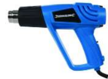
PISTOLET DECAPEUR REGLABLE