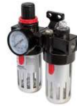
FILTRE DESHYDRATEUR / REGULATEUR