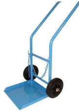
CHARIOT PORTE BOUTEILLE