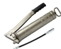
POMPE A GRAISSE