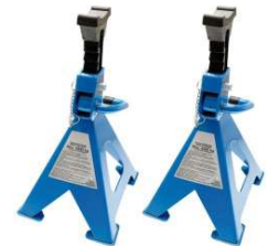
CHANDELLE DE CREMAILLERE