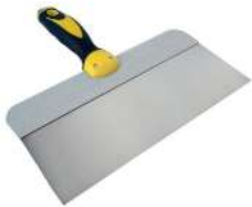
COUPEAU A ENDUIRE