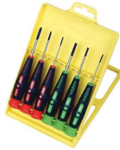
JEU DE TOURNEVIS DE PRECISION