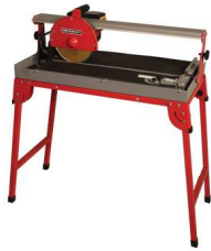
COUPE CARREAUX ELECTRIQUE