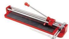
COUPE CARREAUX MANUEL