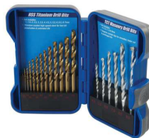
COFFRET DE FORET ACIER