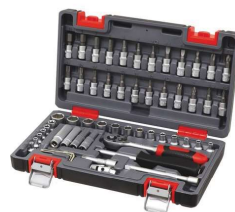
COFFRET DE DOUILLE