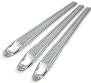
JEU DE DEMONTE PNEU