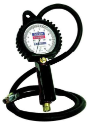
MANOMETRE DE GONFLAGE