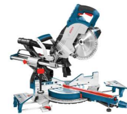
SCIE A ONGLET