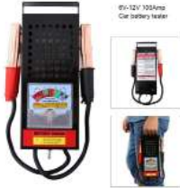
TESTEUR DE BATTERIE