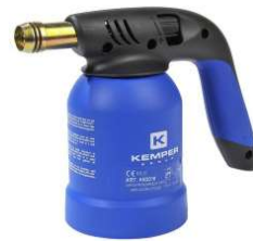
LAMPE A SOUDER