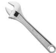
CLE A MOLETTE