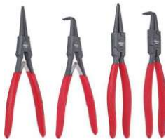
JEU DE PINCE A CIRCLIP