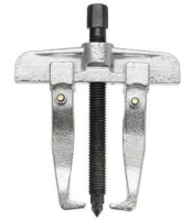
EXTRACTEUR DE ROULEMENT