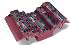
CAISSE A OUTILS