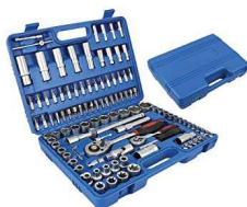
COFFRET A CLE