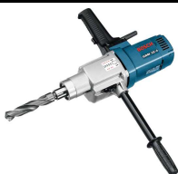
PERCEUSE A COLONNE