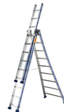
ECHELLE A PLUSIEURS PLAN