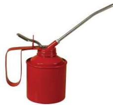
BURETTE A HUILE